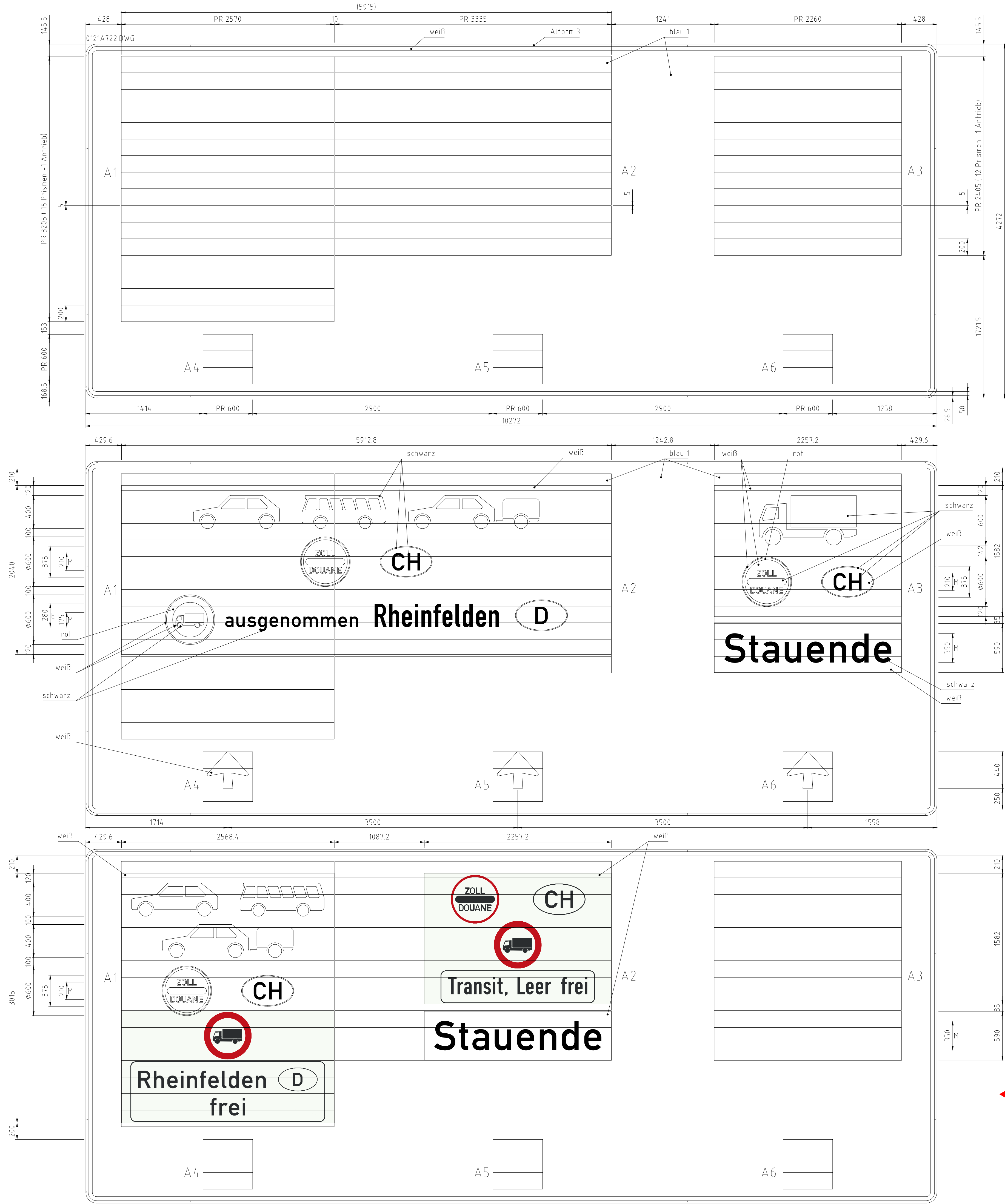
Bild 1 Achtung: Darstellung der Prismenseiten nicht der Programmzustände